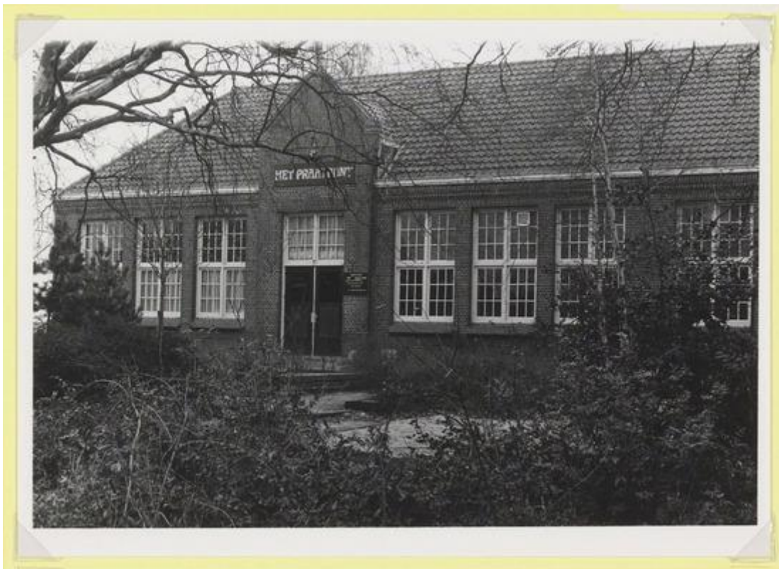
Foto van dorps huis Het Praatpunt voor de brand.